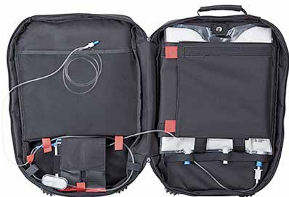
activ Rucksack mini