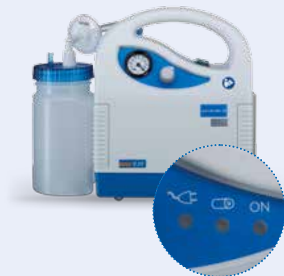
Mobile Geräte mit farbiger LED-Statusanzeige

Sowohl das sanabelle M20-Absauggerät als auch die Geräte der sanabelle M Plus -Serie eignen sich für den mobilen Einsatz (M = mobil). Hohe Akkukapazitäten, LED Statusanzeigen sowie die Möglichkeit des Akkuladens mittels des dazugehörigen Netzgerätes - auch während der Nutzung - garantieren dem Anwender eine hohe Zuverlässigkeit im mobilen Einsatz.