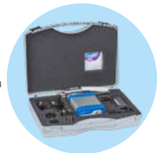
Handlicher Transportkoffer für organisierte Aufbe- wahrung der Komponenten