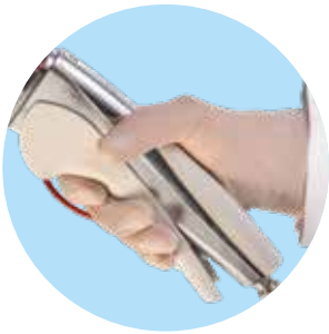
Ergonomisch geformte Handschweißzange