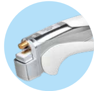
Handschweißzange mit Indikator-LED