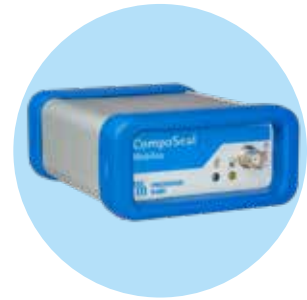
Robustes Powerpack mit Lithium-Polymer Akku