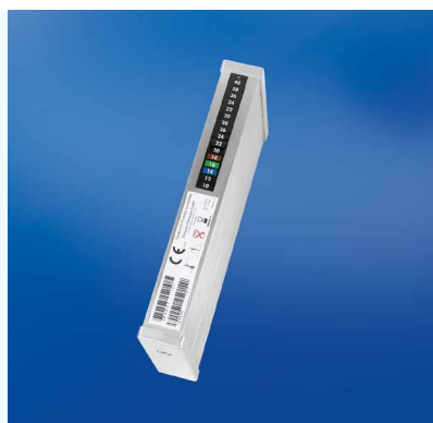
Cada elemento de resfriamento apresenta um número de série determinando a vida útil do produto.