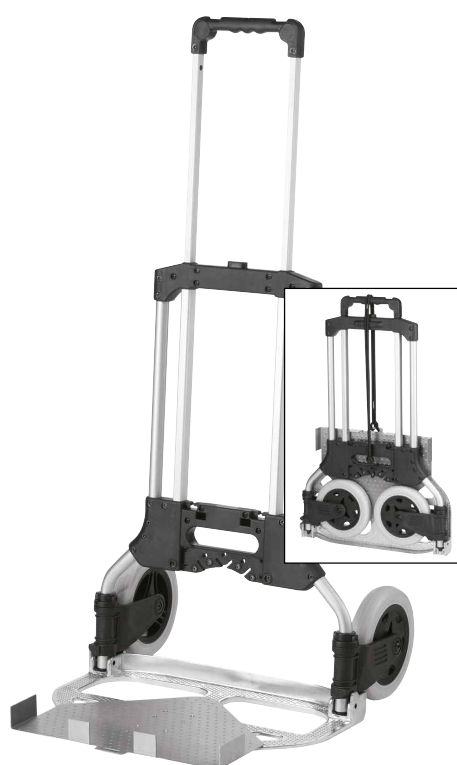
Carrinho de transporte requer espaço mínimo durante o transporte e pode ser facilmente carregado. Transporte seguro para 4 caixas completas.