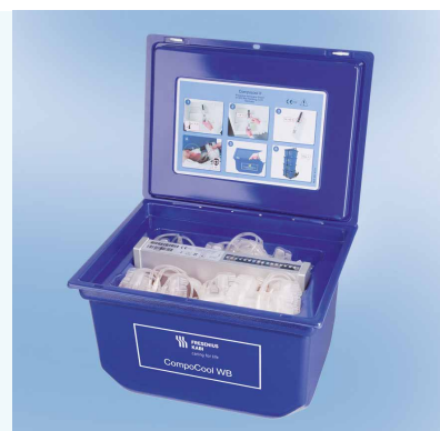
Cada caixa de transporte tem capacidade para acomodar até 6 unidades de sangue total. As tampas das caixas apresentam instruções de uso detalhadas e ilustradas.