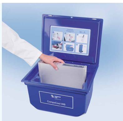
Este elemento de resfriamento removível deve ser armazenado no refrigerador a 4°C por no mínimo 16h. A barra indicativa da temperatura/termômetro exibe a temperatura atual no interior da caixa.