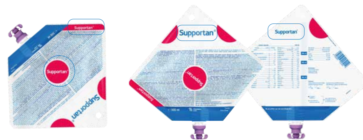
..... Stående pose .....

4 Bedre og tydeligere synlighet av produktnavn