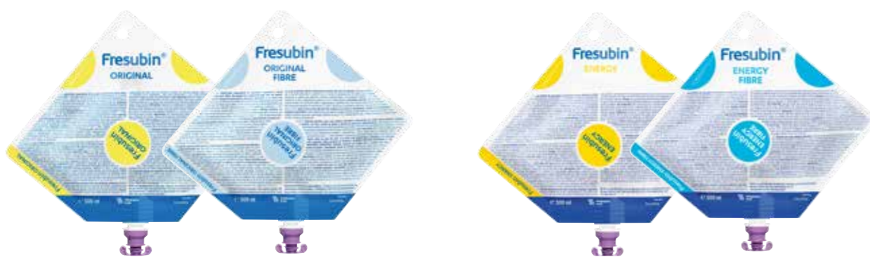
Fiberfri og fiberholdig variant av samme produkt har forskjellig farge for å unngå forveksling.

1 Tydeligere skille mellom fiberfrie og fiberholdige løsninger