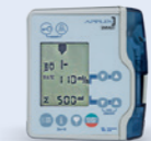
Applix Ernährungspumpe enteral