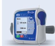
Amika Ernährungspumpe enteral