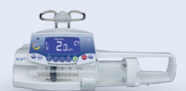
Injectomat Agilia Infusionspumpe